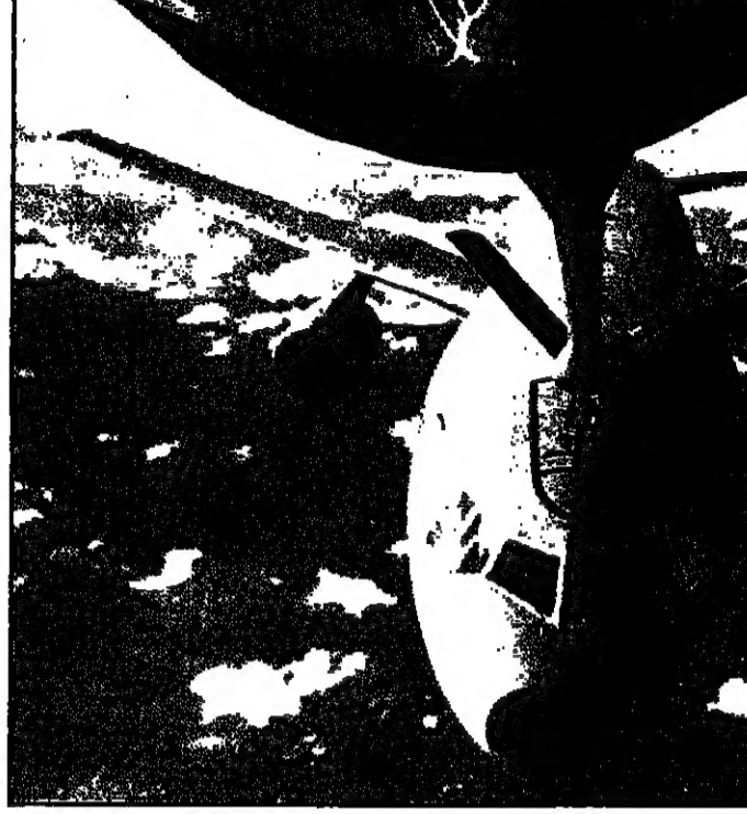
مطار أميركية من طراز "KC-10" تتزود بالوقود أثناء توجهها إلى الخليج الجمعة

تقرير 8 بعد الدوحة تبدأ معركة اجتماع دول اعلان دمشق دأى 17 الدور الأمريكي الذي يوظف العنف لتأكيد هيمنتها